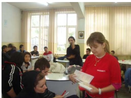
Sesiune de instruire a voluntarilor

La Iași, ARAS a promovat voluntariatul prin exemple concrete oferite de voluntarii organizației. Tot o campanie de promovare a voluntariatului, de această dată în rândul elevilor, a realizat Centrul de Inițiativă Civică Alexandru cel Bun , la școala „Petru Poni” din Iași.