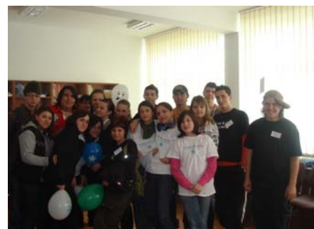
Membri clubului tinerilor ADV

Elevii liceului „Mihal Sturdza” au beneficiat de o campanie de promovare a voluntariatului susținută de Fundația Pro Women în timp ce voluntarii organizației Salvați Copiii au avut ocazia să facă un schimb de experiențe și bune practici cu voluntarii Societății de Psihologie.