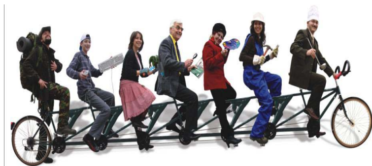
Posterul SNV 2008

SNVa împlinit șapte ani odată cu ediția din acest an. Ca orice copil ajuns la vârsta de școală, SNV s-a maturizat, a crescut față de ceilalți ani și și-a luat misiunea din ce în ce mai în serios.. În rândurile care urmează vă vom spune povestea imaginii SNV din acest an.